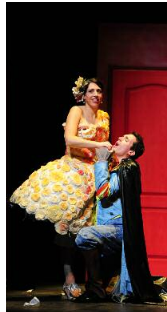
Le Barbier de Séville, 2015

La compagnie mettra en avant l'image sociale de ses partenaires mécènes lors des spectacles et à l'occasion des communications (Presse, Radio, Télévision)