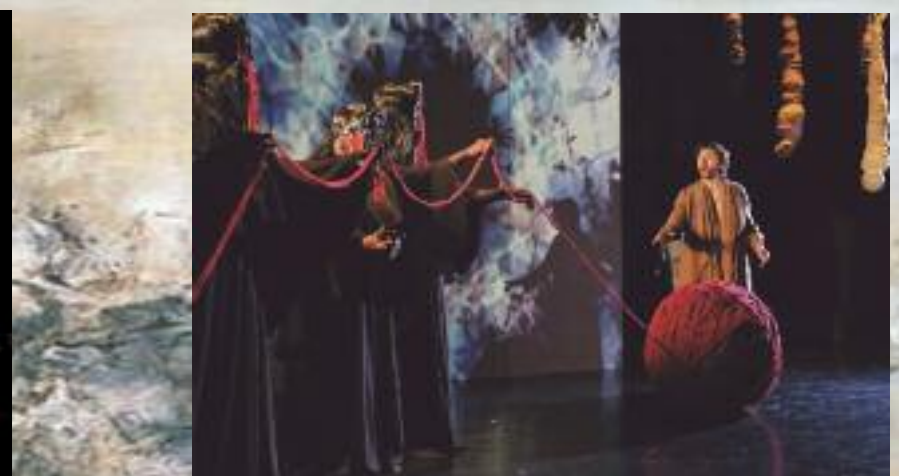
Tableau III, Les Parques