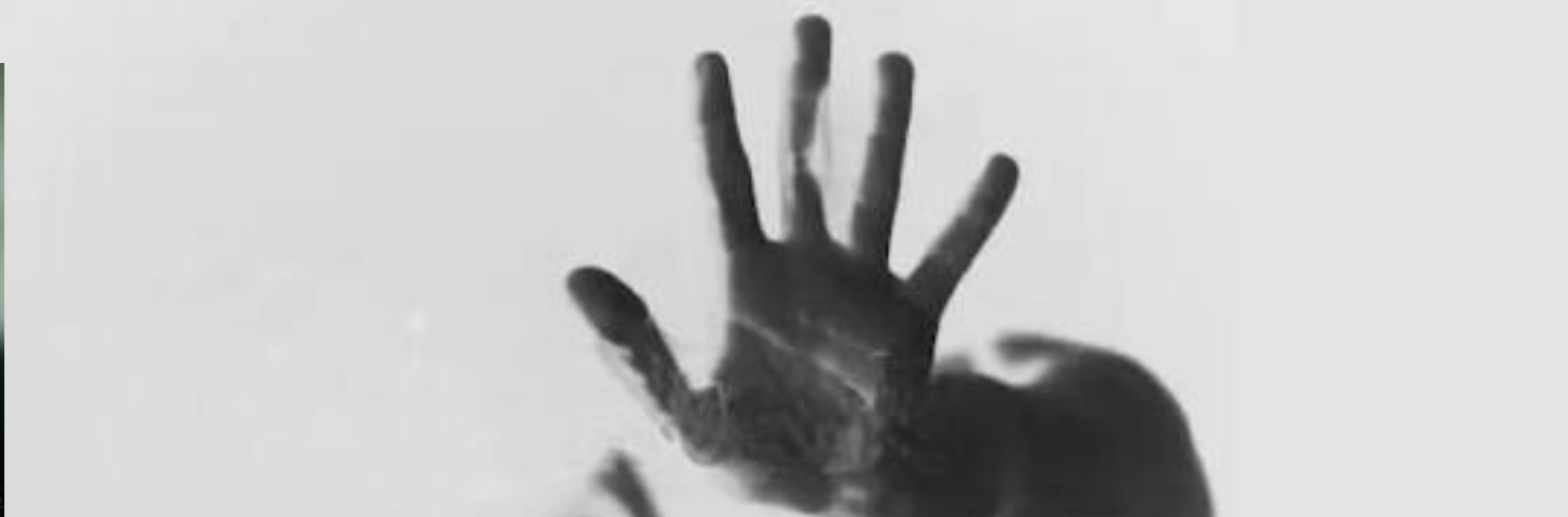
Yété Queiroz - Dalila