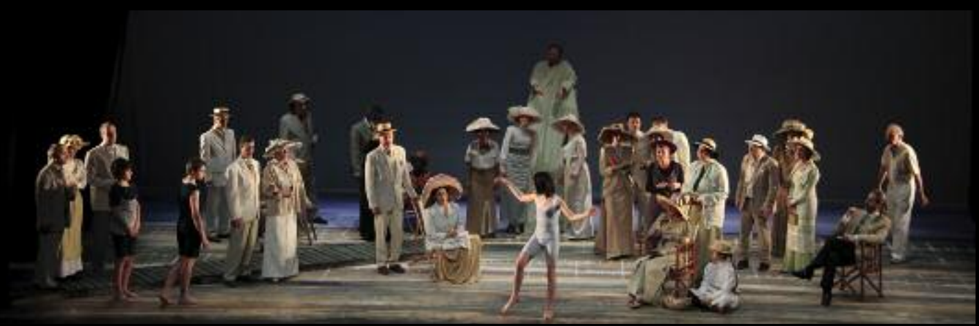
En 2021, Samson et Dalila