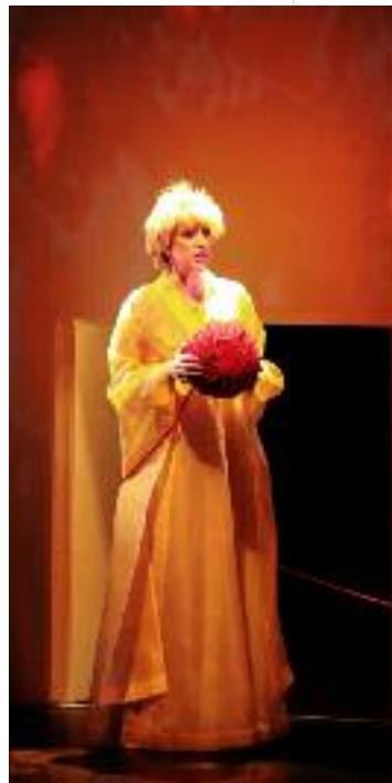
Orfeo ed Euridice , 2018

Elle collabore avec des artistes de qualité (Voir extraits d'articles de presse en fin de dossier).