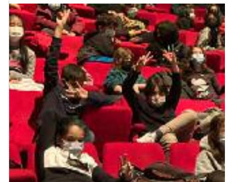
Jeune public en plein débat après représentation de Didon et Enée , 2021

Elle propose de développer, selon la demande, des actions artistiques et culturelles destinées au jeune public, autour de ses spectacles. Cette initiation comprend la découverte et l'explicitation des codes et conventions qui sous-tendent ce type de spectacle, afin de familiariser le jeune spectateur à un univers susceptible de lui procurer des émotions artistiques immédiates, émotions qu'il pourra approfondir par la suite au gré de ses expériences personnelles.