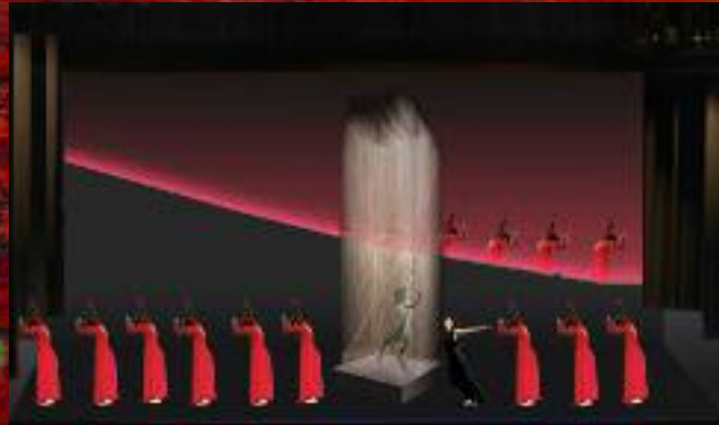
Tableau I, La mise au tombeau