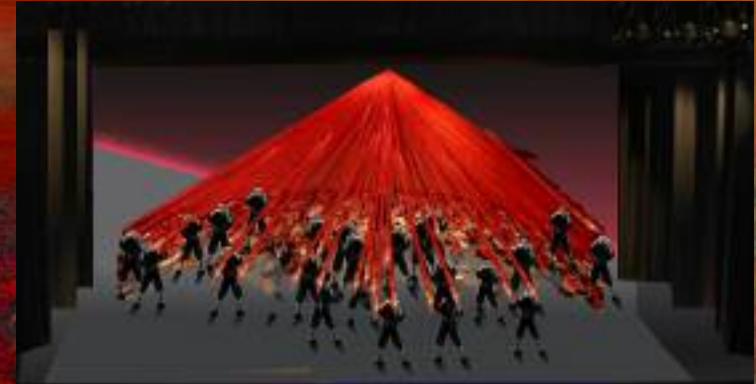
Tableau II, Les cerbères