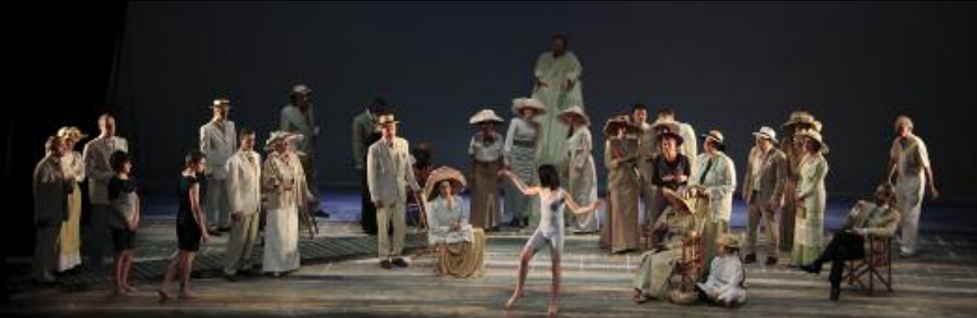
En 2012, Norma