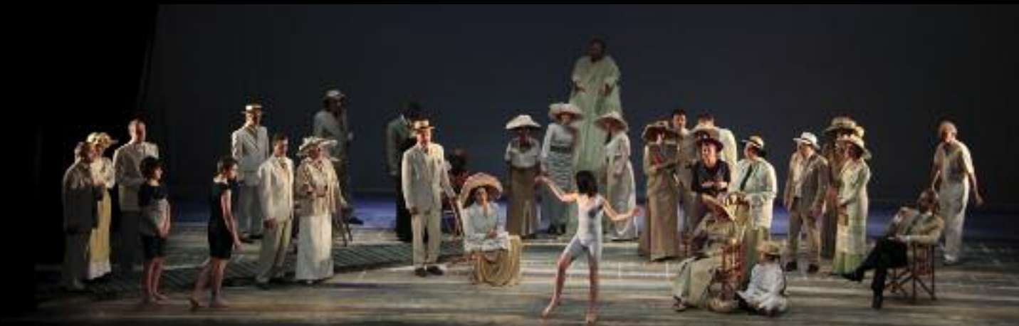
En 2012, Norma