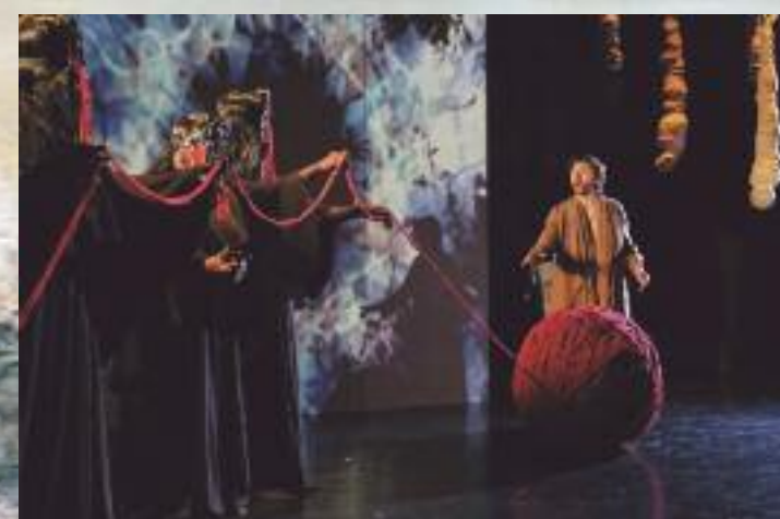
Tableau III, Les Parques