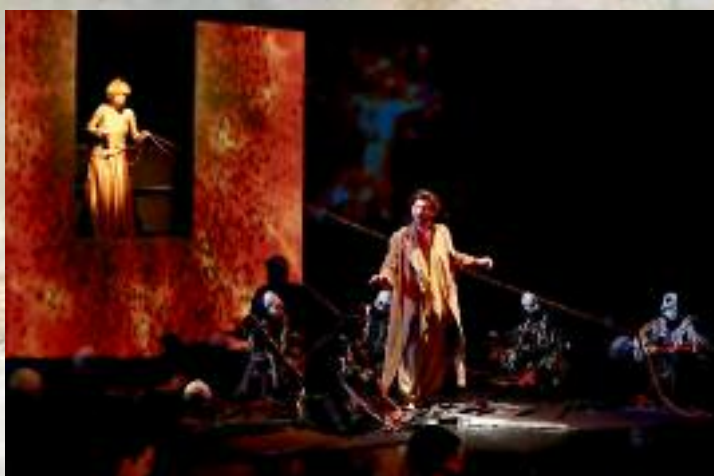
Tableau II, Les Cerbères