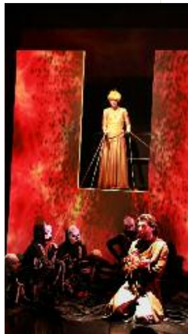
Orfeo , 2018

Elle collabore avec des artistes de qualité. (Voir extraits d'articles de presse).