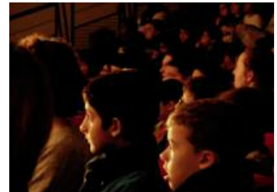
Jeune public assistant à une représentation de La Traviata , 2016

Elle propose de développer, selon la demande, des actions artistiques et culturelles destinées au jeune public, autour de ses spectacles. Cette initiation comprend la découverte et l'explicitation des codes et conventions qui sous-tendent ce type de spectacle, afin de familiariser le jeune spectateur à un univers susceptible de lui procurer des émotions artistiques immédiates, émotions qu'il pourra approfondir par la suite au gré de ses expériences personnelles.