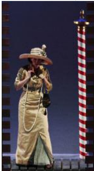
Mort à Venise , 2010

Nous employons essentiellement des artistes et des musiciens français.